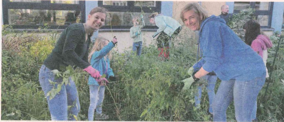
Eltern, Kinder und Lehrkräfte der Cretzschmar-Schule packten gleichermaßen mit an, um den Schulhof winterfest zu machen und neues Grün anzupflanzen.