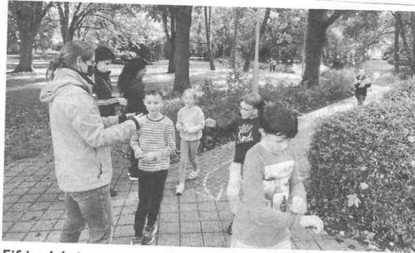
Eifrig dabei waren die Schülerinnen und Schüler der Cretzschmar-Schule bei ihrem Sponsorenlauf durch den Heinrich-Kleber-Park.