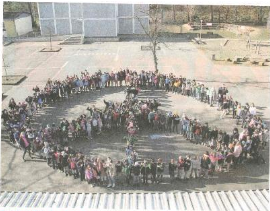
Zeichen für den Frieden. Wie in vielen Schulen im Main-Taunus-Kreis formten auch die Cretschmarschüler und schülerinnen ein buntes Friedenssymbol. Am vergangenen Freitag kamen sie dazu auf dem Schulhof der Sulzbacher Grundschule zusammen.