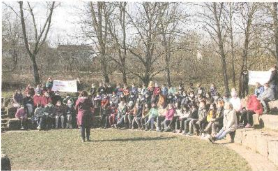
Auf den Steinsitzen im Schulhof feierte die Cretzschmarschule die Auszeichnung.

Gemeinsam mit der Schulleitung und den Lehrkräften freuten sich die Schülerinnen und Schüler am vergangenen Freitagvormittag im Freien auf den Steinsitzen des Schulhofs über die Auszeichnung. gs